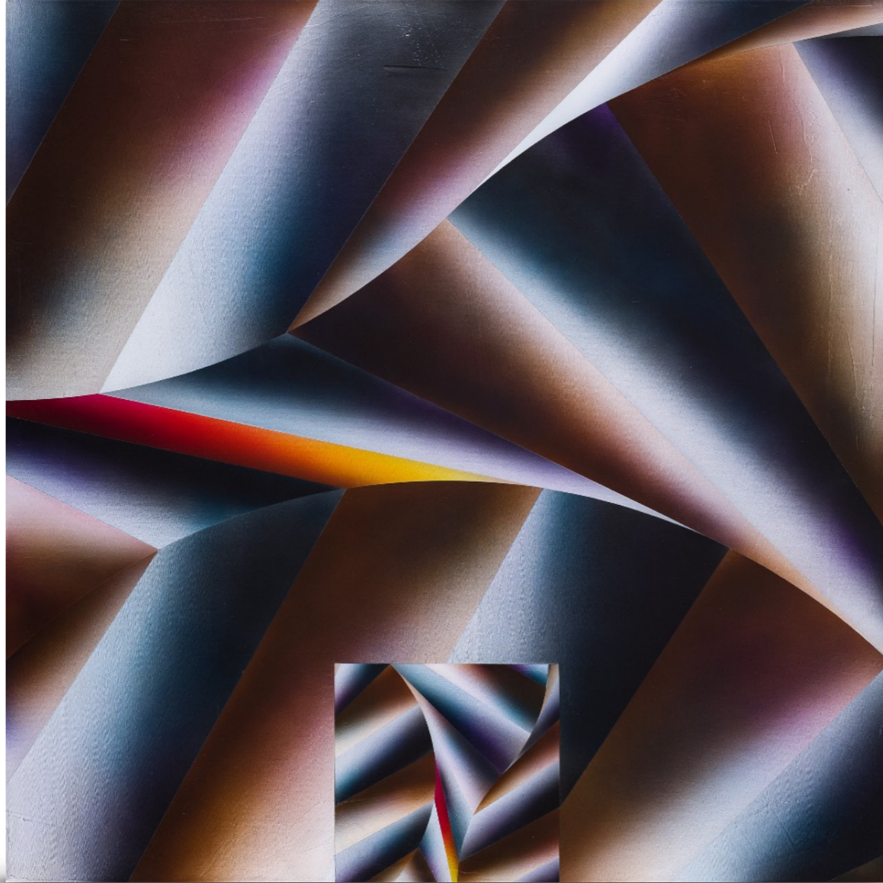
Sin título. Acrílico sobre tela. 81 x 81 cm. 32 x 32 in. Circa año 1999.