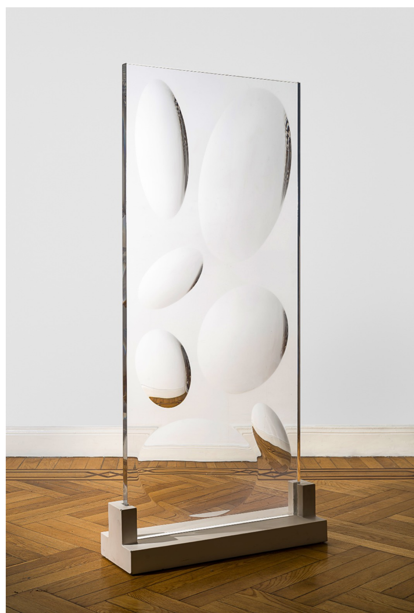
Sin título. Acrílico tallado. 140 x 60 x 3 cm. 55 x 23,6 x 1,2 in. Año 1979. Pieza única.