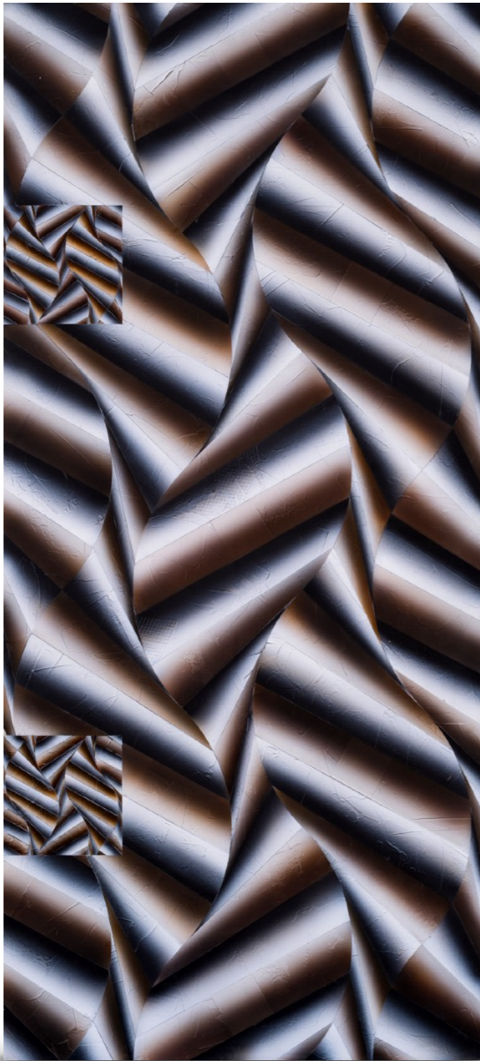
Sin título (proyecto para mural Bank Boston) Acrílico sobre madera. 54 x 120 cm. Año 2000. Mencionado en Rogelio Polesello , Museo Nacional de Bellas Artes, 2000. Página 162.