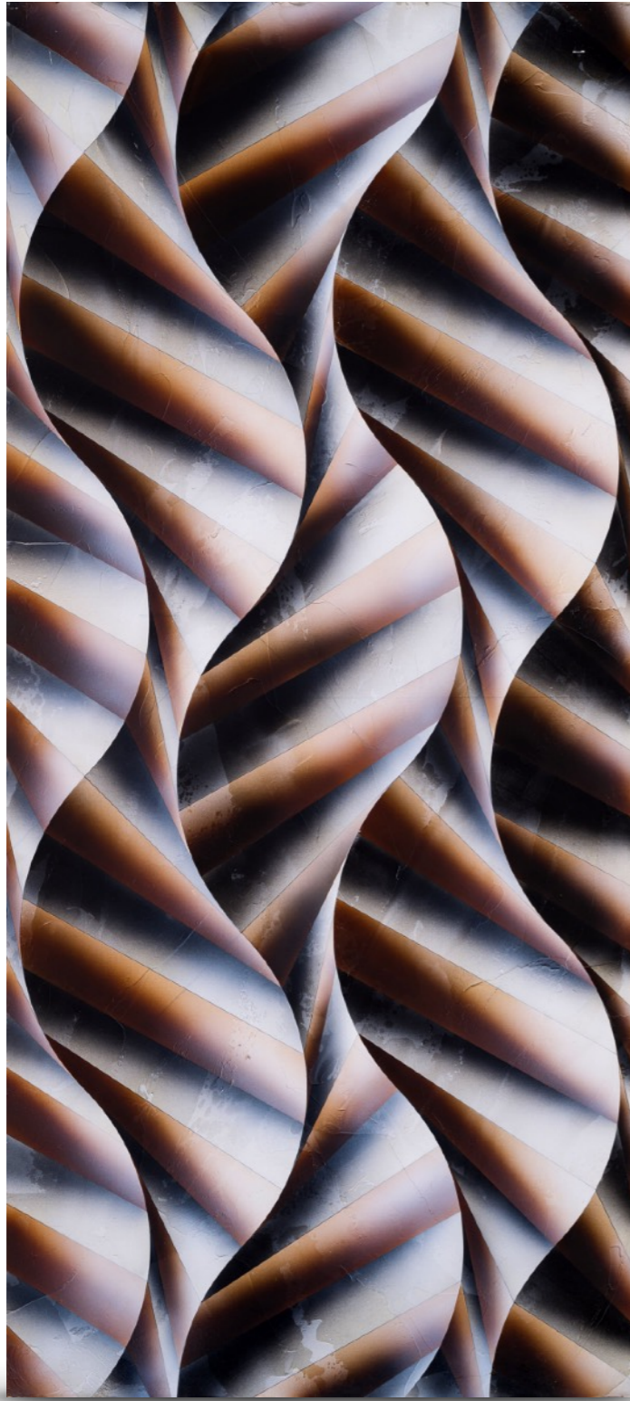
Sin título (proyecto para mural Bank Boston) Acrílico sobre madera. 54 x 120 cm. Año 2000. Mencionado en Rogelio Polesello , Museo Nacional de Bellas Artes, 2000. Página 162.