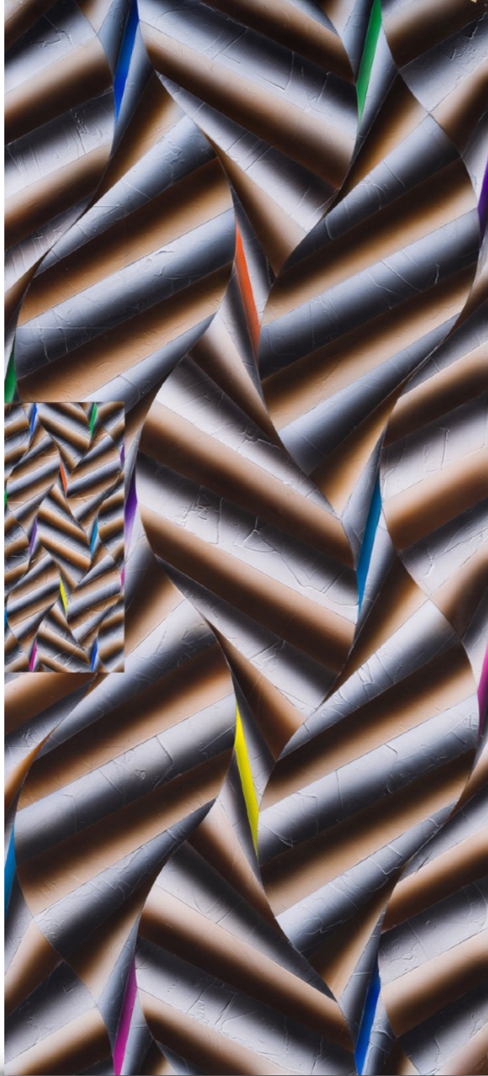
Sin título (proyecto para mural Bank Boston) Acrílico sobre madera. 54 x 120 cm. Año 2000. Mencionado en Rogelio Polesello , Museo Nacional de Bellas Artes, 2000. Página 162.