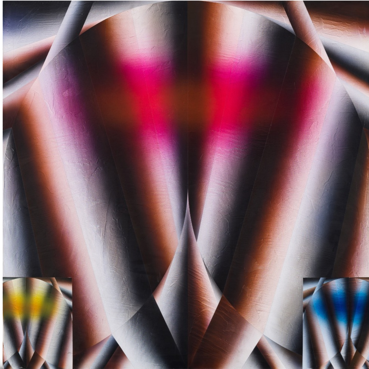
Posible Juego. Acrílico sobre tela. 100 x 100 cm. 39,3 x 39,3 in. Año 1999.