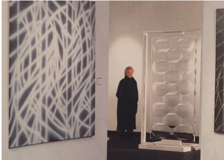
Rogelio Polesello, 2000. Rogelio Polesello en el Museo Nacional de Bellas Artes, Buenos Aires.